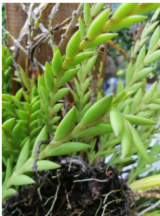
รูปที่ ๖ เอื้องตะขาบจิ๋ว

เพื่อเป็นการอนุรักษ์พันธุ์กรรมพืชสกุลกล้วยไม้ตัวอย่าง ควรมีการนำมาขยายพันธุ์ในห้องปฏิบัติการ เช่น นำมาขยายพันธุ์ด้วยวิธีการเพาะเลี้ยงเนื้อเยื่อพืช การแยกหน่อ สำหรับชนิดพันธุ์กล้วยไม้ที่สนใจศึกษา คือ เอื้องตะขาบจิ๋ว ( Schoenorchis scolopendria ) และเอื้องตะขาบใหญ่ ( Dendrobium leonis (Lindl.) Rchb.f.) จากการค้นคว้าในเชิงสรรพคุณเชิงยาสมุนไพร