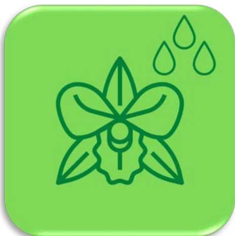
ออกดอกฤดูฝน