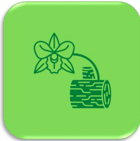
กล้วยไม้อิงอาศัย