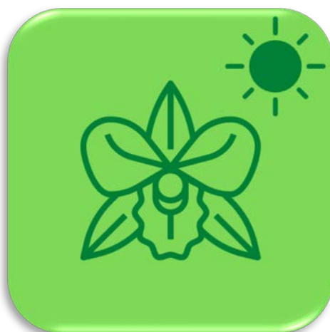
ออกดอกฤดูร้อน