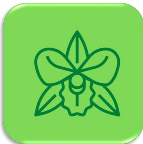
ออกดอกตลอดปี