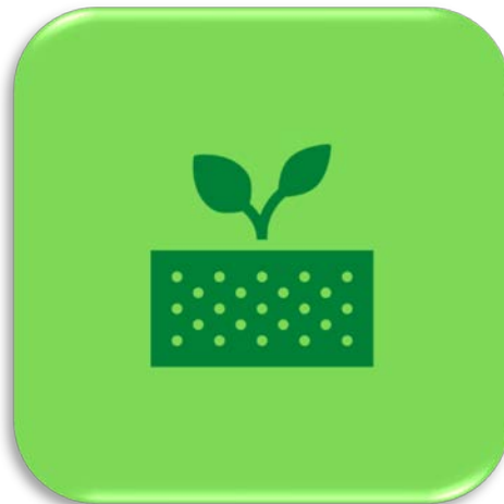
กล้วยไม้เจริญทางยอด