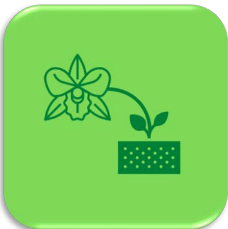
กล้วยไม้ดิน