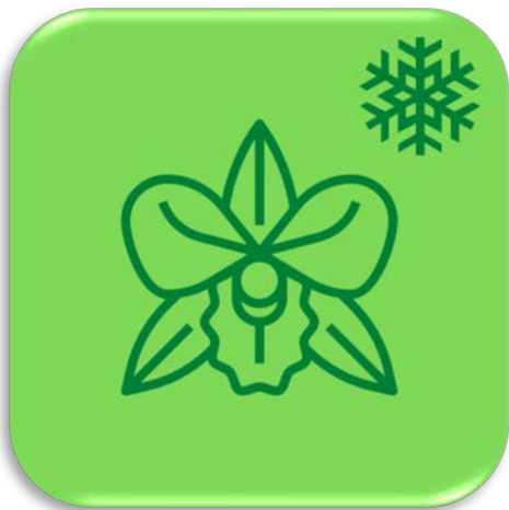
ออกดอกฤดูหนาว