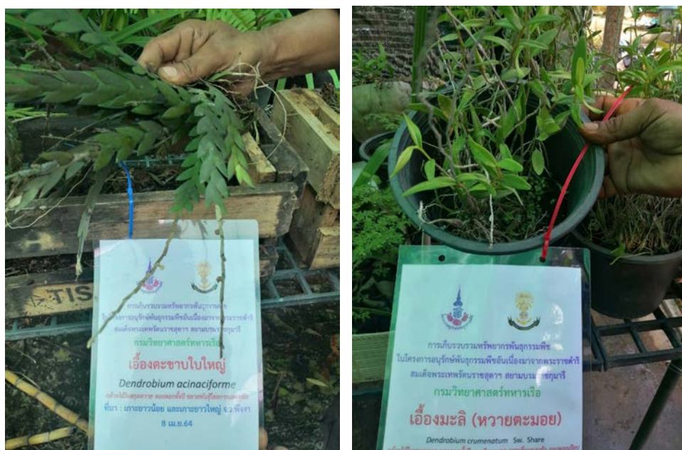
รูปที่ ๔ การอนุรักษ์และการอนุบาลตัวอย่างกล้วยไม้จากการสำรวจ

การสำรวจและการเก็บตัวอย่างพันธุ์กล้วยไม้ ได้ดำเนินการสำรวจตามเส้นทางการศึกษาธรรมชาติทั้งหมด ๔ เส้นทางและในพื้นที่ปกปัก ตามรูปที่ ๑ และ ๒ โดยบันทึก สภาพแวดล้อมที่กล้วยไม้เกิด ลักษณะทางกายภาพ ได้แก่ อุณหภูมิ ความชื้น พิกัดทางภูมิศาสตร์ และความสูงจากระดับน้ำทะเล เลือกเก็บตัวอย่างเฉพาะที่มีความสมบูรณ์มีขนาดแตกต่างกันตามอายุ อย่างไรก็ตามยังไม่ได้ดำเนินการศึกษาโครงสร้างภายในห้องปฏิบัติการ เมื่อนำมายังกรมวิทยาศาสตร์ทหารเรือ พื้นที่พุทธมณฑลสาย ๓ เขตทวีวัฒนา กรุงเทพฯ ได้นำตัวอย่างกล้วยไม้มาอนุบาลโดยใช้วัสดุปลูก และโรงเรือนที่มีการให้น้ำละอองฝอย เพื่อรักษาความชื้นภายในรากและลำต้น จากนั้นได้แบ่งขยายลงในถ้วยปลูกที่มีวัสดุปลูกคือ เปลือกมะพร้าวสับหยาบ และขอนไม้ ทั้งนี้ให้เหมือนลักษณะที่ของตัวอย่างที่เกิดในธรรมชาติ