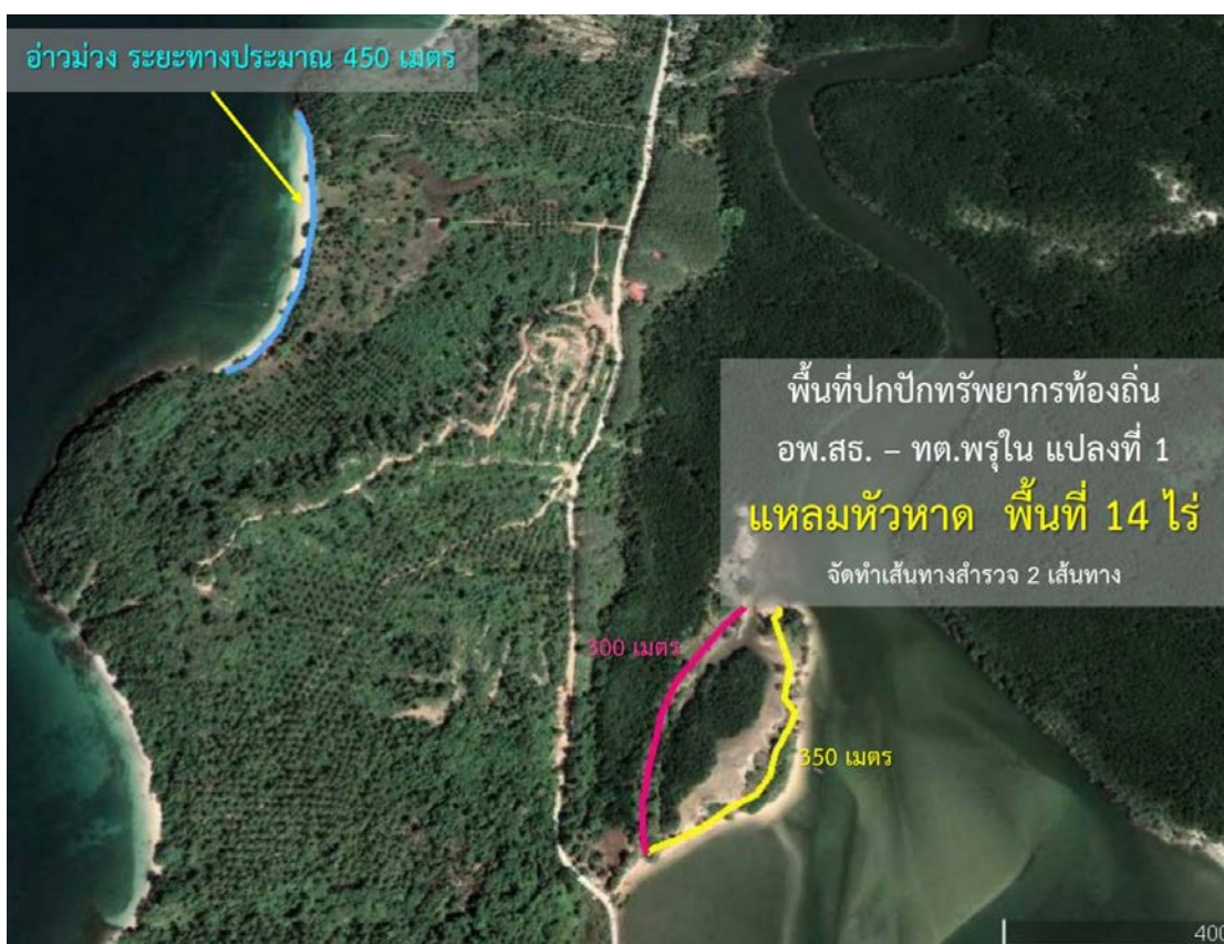
รูปที่ ๑ เส้นทางสำรวจกล้วยไม้ในโครงการอนุรักษ์พันธุกรรมพืช ฯ วศ.ทร. บริเวณพื้นที่ปกปักแหลมหัวหาด

การสำรวจความหลากหลายของพืชวงศ์กล้วยไม้และแนวทางการใช้ประโยชน์บริเวณเกาะ ยาวน้อยเกาะยาวใหญ่และหมู่เกาะข้างเคียง จังหวัดพังงา ดำเนินงานโดยคณะสำรวจคณะทำงานอนุรักษ์พันธุกรรมพืช อันเนื่องมาจากพระราชดำริ วศ.ทร. ภายใต้ โครงการอนุรักษ์พันธุกรรมพืช อันเนื่องมาจากพระราชดำริ สมเด็จพระเทพรัตนราชสุดาฯ สยามบรมราชกุมารี กองทัพเรือ บริเวณ พื้นที่เกาะยาวน้อยเกาะยาวใหญ่ จังหวัดพังงา วันที่ ๓ - ๑๑ เมษายน ๒๕๖๔ ทั้งนี้ เป็นไปตาม แผนงานประจำปีงบประมาณ พ.ศ.๒๕๖๔