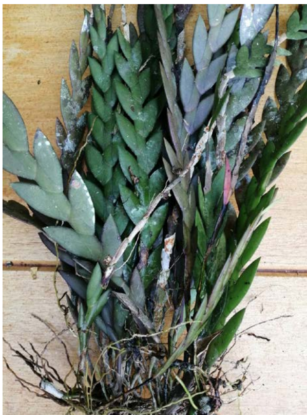
รูปที่ ๗ เอื้องตะขาบใบใหญ่

ชื่อวิทยาศาสตร์ Dendrobium leonis (Lindl.) Rchb.f.