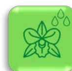
รูป เอื้องสิงโต (กล้วยไม้สิงโตนกเหยี่ยวใหญ่)