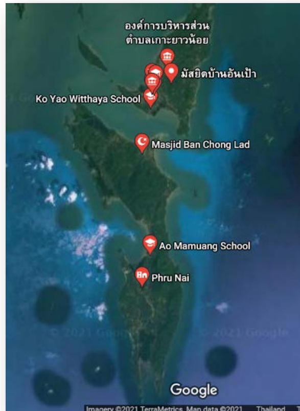
รูปที่ ๓ แผนที่เกาะยาวน้อยและยาวใหญ่

ภูมิศาสตร์ ที่ตั้งอำเภอเกาะยาวตั้งอยู่บนเกาะในทะเลอันดามันมหาสมุทรอินเดีย มีเกาะเล็กเกาะน้อยอยู่ในเขตการปกครอง ทั้งหมดจำนวน ๔๔ เกาะ ที่ว่าการอำเภอตั้งอยู่ที่เกาะยาวน้อย ที่หมู่ที่ ๑ ตำบลเกาะยาวน้อย มีพื้นที่ทั้งหมดประมาณ ๑๓๗ ตารางกิโลเมตร มีอาณาเขตติดต่อกับท้องที่ใกล้เคียงดังนี้ ทิศเหนือ ติดต่อกับ อำเภอเมืองพังงา จังหวัดพังงา ทิศใต้ ติดต่อกับ มหาสมุทรอินเดีย ทิศตะวันออก ติดต่อกับ อำเภอเมืองกระบี่ จังหวัดกระบี่ ทิศตะวันตก ติดต่อกับ อำเภอถลาง จังหวัดภูเก็ต