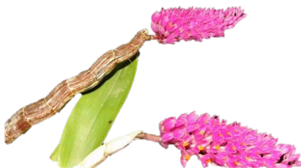
รูปที่ ๕ เอื้องแปร่งสีฟัน

๒. การสำรวจตามเส้นทาง ABCD พบว่า ไม่พบกล้วยไม้ในเส้นทาง D แต่สามารถพบได้ในเส้นทางศึกษา ABC โดยเฉพาะเส้นทางที่มีจุดเชื่อมต่อของแหล่งน้ำลำธาร สามารถพบกล้วยไม้เด่นได้หลายชนิด ได้แก่ เอื้องแปร่งสีฟัน เอื้องมะลิ (หวายตะมอย) เอื้องตะขาบจิ๋ว เอื้องตะขาบใหญ่ เอื้องสิงโต เอื้องกุหลาบกระเปาะเปิด รวมไปถึงเฟิร์นชายผ้าสีดา อย่างไรก็ตาม ลักษณะของรากแตกใหม่ค่อนข้างน้อย/ไม่สมบูรณ์ ไม่พบฝักกล้วยไม้ ลักษณะของสมบูรณ์ของต้นอยู่ในช่วงปานกลาง คือคือใบหรือยอดแตกใหม่บ้าง บางส่วนของต้นแห้งตาย แหล่งที่พบมักกระจายหรือห่างตามเส้นทางสำรวจสำหรับกล้วยไม้ที่พบขณะกำลังออกดอกคือ เอื้องแปร่งสีฟันใต้ (DENDROBIUM SECUNDUM LINDL.) มีดอกสีชมพู สีชมพู-ขาว สภาพออกดอกค่อนข้างยาว (๘-๑๑ ซม.) ลำต้นเป็นรูปแท่งดินสอปลายเรียวแหลมและตั้งขึ้น ใบเป็นรูปไข่แกมรูปขอบขนาน เวลาที่มีดอกจะทิ้งใบหมด ดอก ออกเป็นช่อตามข้อใกล้ปลายยอด ซึ่งสีของกลีบดอกจะมีความโดดเด่นและแตกต่างจากสีของกลีบดอกเอื้องแปร่งสีฟันทั่วไปคือ กลีบดอกส่วนบนหรือครึ่งบนจะเป็นสีชมพูอ่อน ส่วนครึ่งล่างหรือส่วนล่างจะเป็นสีขาวชัดเจน ดอกเมื่อบานเต็มที่กว้างประมาณ ๐.๕ ซม.