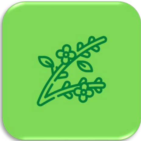
กล้วยไม้เจริญทางด้านข้าง