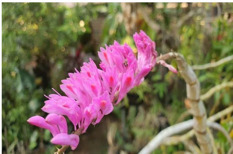
รูป เอื้องแปร่งสีฟัน